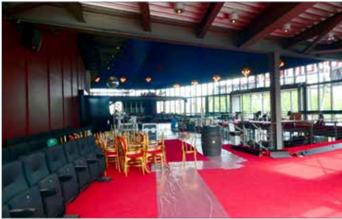
Im September fehlte noch jeglicher Prunk. Im leeren Foyer stehen die neuen Stühle für den Saal bereit. Fotos: Elisa Cominato [2]