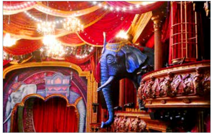
Schmuckvoll verzierte seitliche Balkone geben dem Raum ein besonderes Flair und zeigen, wie detailreich das Team in jeder Hinsicht arbeitet