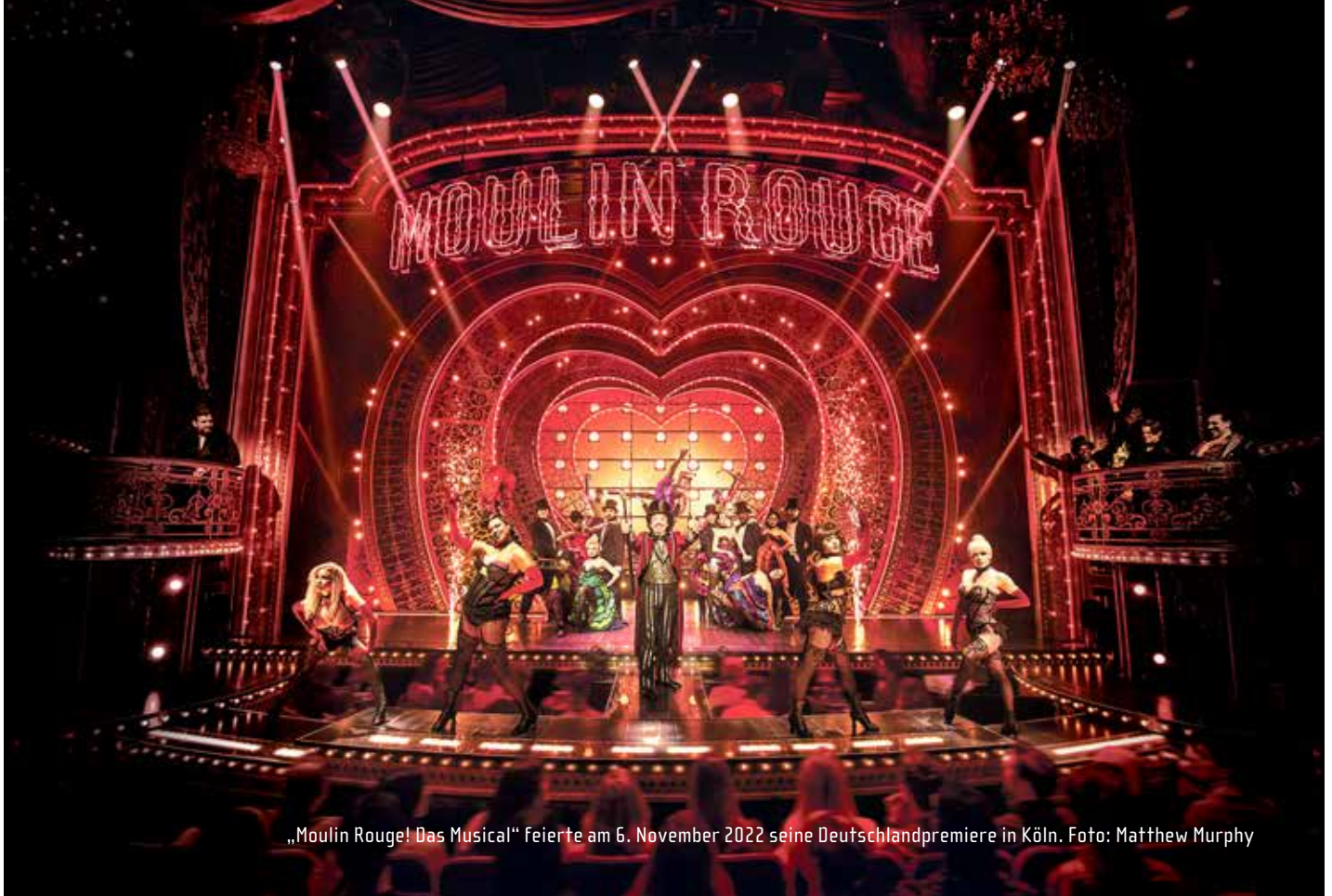
„Moulin Rouge! Das Musical“ feierte am 6. November 2022 seine Deutschlandpremiere in Köln.