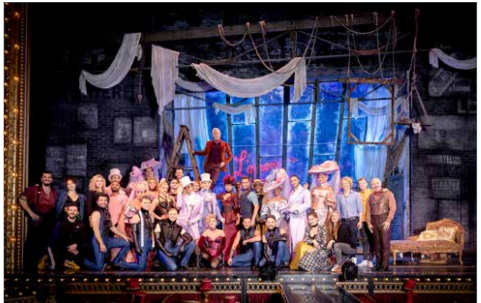
Regisseur und Drehbuchautor Baz Luhrmann beim Besuch in Köln [auf der Leiter]; er kuratierte die künstlerischen Prozesse im Rahmen der ersten Übertragung des Films ins Musical.

Auch der Casting-Prozess während der Pandemie war kein leichtes Unterfangen. Für jeden analogen Termin wurden tagesgenaue Testungen für mehrere Tausend Personen realisiert. Ebenfalls waren die Proben aufgrund des