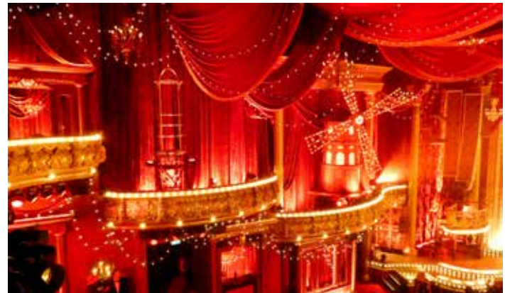
Roter Samt, liebevoll und detailreich gestaltete Deko sowie warmes Licht schenken dem Saal eine königliche Atmosphäre

Zusammen mit den Besonderheiten des Bühnenbodens können die Einzelteile des Bühnenbilds auf 60 verschiedenen Achsen bewegt werden. Der Bühnenboden seinerseits ist ebenfalls komplett neu, nur ein kleiner Teil des alten Bodens ist als Untergrund vorhanden, auf dem aufgeständert wurde. Er ist Teil der Dekoration mit eingebauter Maschinerie und bietet mit fünf Fahrschienen die Möglichkeit, Bühnenelemente von links nach rechts, von hinten nach vorne, bis zur Mitte und über die Mitte hinaus zu bewegen sowie Effekte wie Nebel oder Pyrotechnik aus dem Boden heraus zu steuern. Auch diese bewusst gewählte Varianz