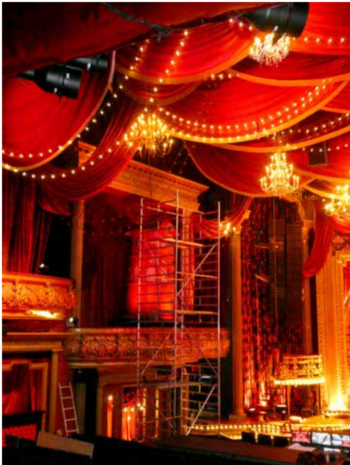
Noch ohne Flügel: die rote Mühle während des Um- und Aufbaus.

Eine Besonderheit in puncto Bühnenboden ist der Bandraum darunter. Die Musik in „Moulin Rouge“ wird natürlich live gespielt, doch einen klassischen Orchestergraben gibt es nicht, da zwischen Bühne und Publikumsplätzen noch eine Passerelle errichtet wurde. Der Raum zwischen den Laufstegen reicht für 20 Gäste, die sich zeitweise mitten im Geschehen wiederfinden. Somit musste der Platz für die Musiker:innen unter der Bühne geschaffen und die Bühne etwas erhöht positioniert werden, was aber die Sicht für das Publikum nicht beeinflusst. Aufgrund der hohen Rasanz im musikalischen Teil des Stücks – 75 Songs von 165 Komponist:innen führen durch 160 Jahre Musikgeschichte – sind die akustischen Anforderungen entsprechend hoch. Es gibt einzelne Kabinen für jede:n Musiker:in und Panels, die Reflexionen reduzieren. Das Konzept zahlt sich aus: Die Akustik im Musical Dome überzeugt von der ersten bis zur letzten Sekunde, besonders der Gesang ist jederzeit